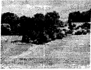
Abb. 4: Gehaus vom Judenfriedhof gesehen