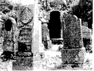
Abb. 6: Grabsteine Kahn, Rehbock und Sonder