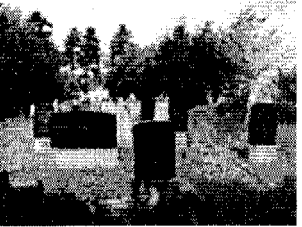
Abb. 7: ältere unbekannte Grabsteine