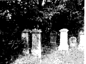
Abb. 8: Grabstein der Familie Nussbaum